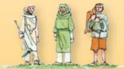
SERVI DELLA GLEBA